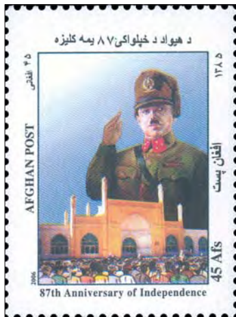
Det här märket hade man dragit in, förmodligen på grund av det Hitlerlika porträttet.

huvudpostkontoret för att köpa frimärken. Det finns ju mindre postkontor här och där i Kabul, som i vilken storstad som helst. Att besöka ett sådant kan också bli både överraskande och underhållande.