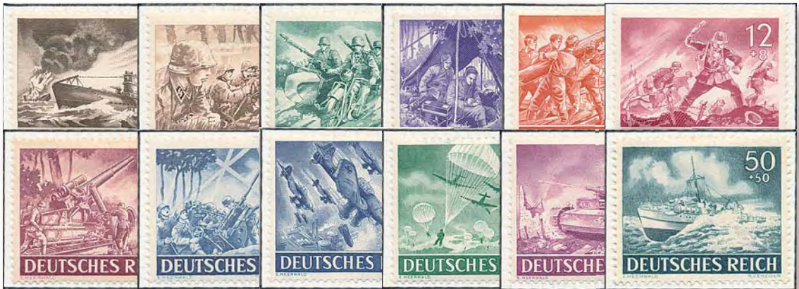
Den av oss barn så eftertraktade "Wehrmachtserien" som jag fick i födelsedagspresent när jag fyllde sex år. Med en så fin serie var jag tvungen att genast tillverka ett insticksalbum!

➔ förskonades vi barn från, åtminstone på landsbygden. Visst var det mycket trafik med soldater, militärfordon och annat, men några strider ägde inte rum i vår by eller i den närmaste omgivningen. Visserligen ljöd bomblarmen ganska ofta, och då flög ibland flera hundra flygplan över oss. Vi barn hade fått lära att då ställa oss under dörrkarmen, men vi kom snart underfund med att planen alltid flög vidare, och då stannade vi kvar utomhus.