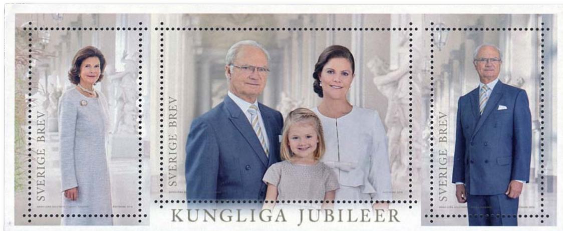
Miniarket Kungliga jubileer som gavs ut 2016, då Carl XVI Gustaf fyllde 70 år.

något märke. Och slottet finns inte längre. En piga slarvade en gång med aska och glöd, och hela rasket försvann i eld och lågor.