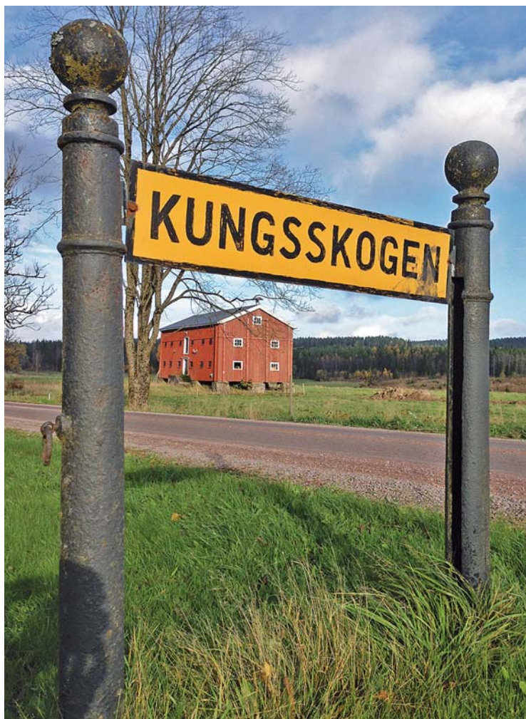
En vacker gammal vägs skylt som fått stå kvar för att hälsa besökare välkomna till Kungsskogen. Undrar vad ringen på den vänstra stolpen var avsedd för?

➔ är en del av de gulnande löven på de omgivande träden.