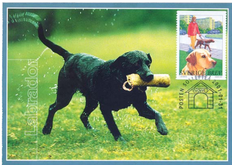
Två gånger har mina hundar ställt till det för mig. En tuggade sönder större delen av en vykortssamling, och en annan – en labrador, som på vykortet – strödde frimärken över hela lägenheten!

Det blev den här gången en betydligt roligare hundhistoria än förra gången, och när en bytestvän i Södertälje fick höra den, tyckte han att jag istället skulle skaffa mig en torkappa-