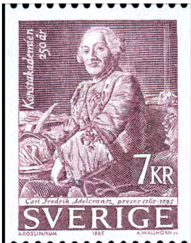
"Konstakademien 250 år" gavs ut 1985 med två olika frimärken. Här ser vi Carl Fredrik Adelcrantz, akademiens förste preses, fint graverad av Arne Wallhorn.