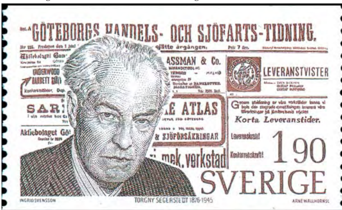
Den legendariske tidningsmannen Torgny Segerstedt på ett mycket trevligt frimärke, graverat av Arne Wallhorn och utgivet 1976.