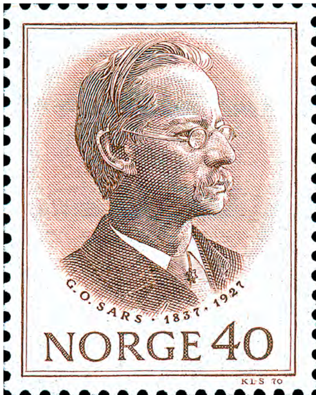
Porträttgravyr är en specialitet inom gravyrkonsten som den norske mästergavören Knut Løkke-Sørensen suveränt behärskar. På detta frimärke från 1970 avbildas den norske marinbiologen Georg Ossian Sars, som 1865 löste problemet om hur man på konstgjord väg skulle befrukta torskrom. Tryckmetod: ståltryck.