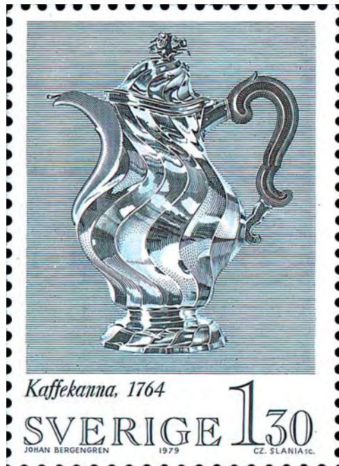
Gravyr i absolut världsklass av Czeslaw Slania. Att gravera fram glansdagar som på detta frimärke ställer oerhörda krav på gravören. Frammärket ingår i blocket "Svensk rokok" som utgavs 1979. Tryckmetod: rasterdjuptyck/ståltryck.