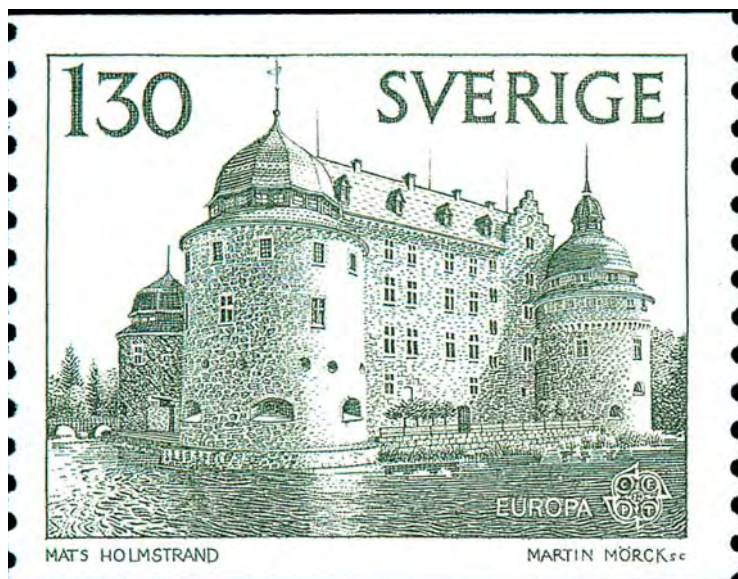
Titta och njut! Örebro slott sett från norr. Frimärket graverat av Martin Mörck 1978. Tryckmetod: ståltryck.