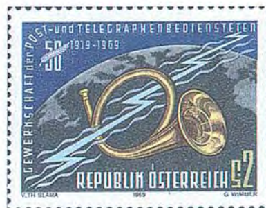
Post- och telegrafanställdas fackförening firade sitt 50-årsjubileum 1969. Tryckmetod: kombinationstryck fotografvyr/ståltryck.