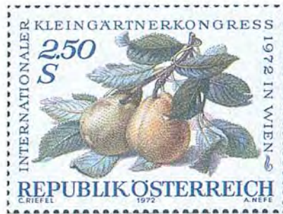
Internationell trädgårdsmästarekongress i Wien uppmärksammas på frimärke. Tryckmetod: kombinationstryck fotografvyr/ståltryck.