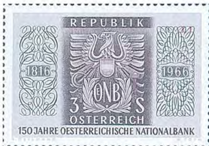
Frimärke utgivet med anledning av att Österrikes nationalbank fyllde 150 år. Tryckmetod: kombinationstryck fotografvyr/ståltryck.