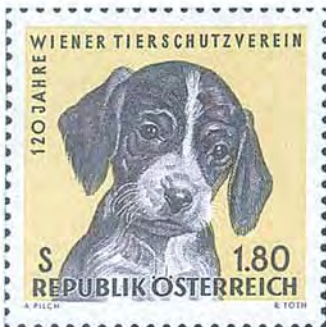
Österrike är lite väl återhållsamma vad gäller djurmotiv på frimärken. Här dock ett trevligt exempel på människans bästa vän. Tryckmetod: kombinationstryck offset/ståltryck.