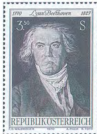
Ludwig van Beethoven var född i Tyskland men även verksam och bosatt i Österrike, där han också avled. Tonsättarens öde tillhör de mest gripande inom musiken. Hörseln sviktade tidigt för att övergå i dövhet. Tryckmetod: kombinationstryck fotografvyr/ståltryck.