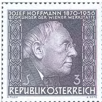
Här hedras den österrikiske världsberömda arkitekten och formgivaren Josef Hoffmann. Tryckmetod: ståltryck.