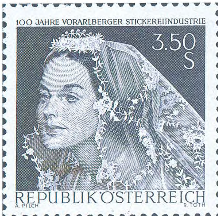
Inhemsk stickeri-industri uppmärksammas på denna vackra utgåva. Tryckmetod: ståltryck.

Det finns alltså epoker i Österrikes historia, även filate-