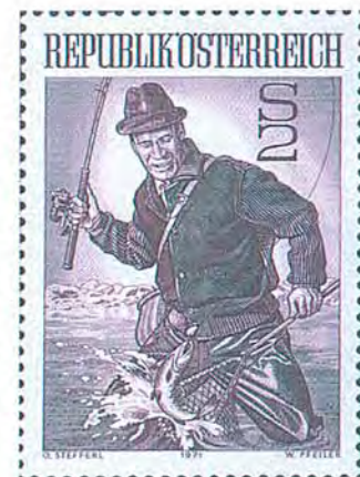
Sportfiske är liksom filatelin en fångslande hobby i många länder! Tryckmetod: ståltryck.