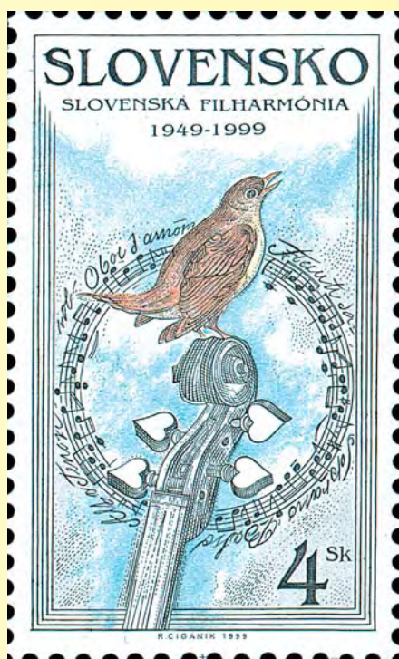
Slovariens filharmoni 50 år. Utgivningsår 1999. Tryckmetod: rasterdjuptryck/ståltryck.