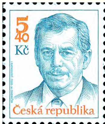
Statsmannen, presidenten och dramatiker Václav Havel hedrad av Tjeckien med fin frimärksgravyr. Utgivningsår 2000. Tryckmetod: rasterdjuptryck/ståltryck.

Angeläget att än en gång framhålla, är att en stor del av frimärkena är handgraverade