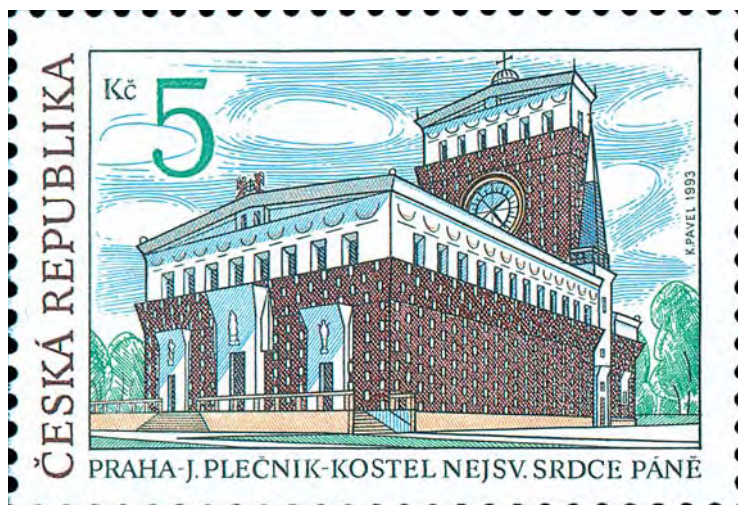
Berömd kyrkbyggnad i Prag. Utgivningsår 1993. Tryckmetod: ståltryck.