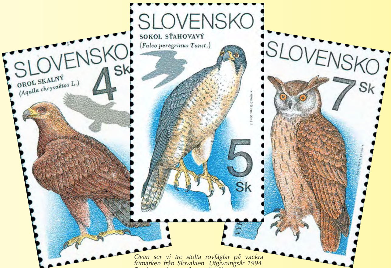
Ovan ser vi tre stolta rovfåglar på vackra frimärken från Slovakien. Utgivningsår 1994. Tryckmetod: rasterdjuptryck/ståltryck.