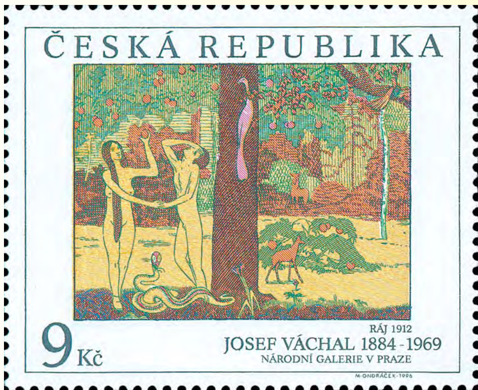
Konstverk från det tjeckiska Nationalgalleriet. Utgivningsår 1996. Tryckmetod: ståltryck.

och ett block. Med denna förnuftiga utgivningstakt skrämmer man inte bort samlarna, utan erbjuder istället kvalitet och förtroende.