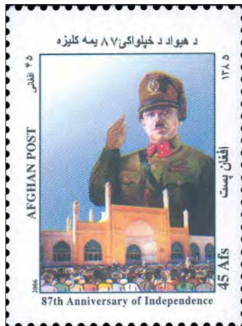
Det här märket hade man dragit in, förmodligen på grund av det Hitlerlika porträttet.

huvudpostkontoret för att köpa frimärken. Det finns ju mindre postkontor här och där i Kabul, som i vilken storstad som helst. Att besöka ett sådant kan också bli både överraskande och underhållande.