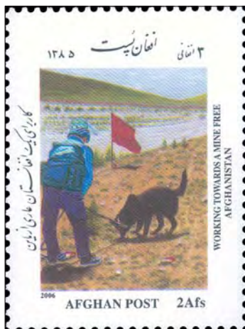
Detta frimärke som visar minröjning, fick författaren köpa långt innan det officiellt kom ut.