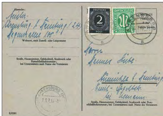
Ett provisoriskt postkort från den brittiska zonen som visar porthöjningen 1946. Den ursprungliga valörstämpeln på 5 pf har tilläggsfrankerats med 7 pf.