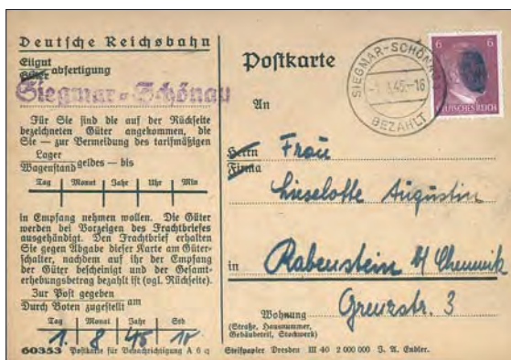
Ett kort med en så kallad Sachsisk svärtning av Hitlers portträtt, och som är en avisering från järnvägen att mottagaren har 44 kilo potatis att hämta!