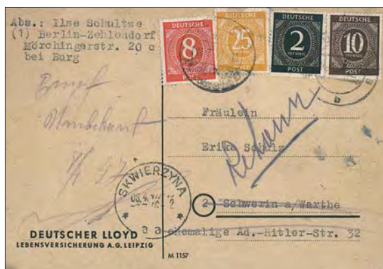
Detta brevkort som adresserats till en fröken i Schwerin, nådde aldrig adressaten. Orten hette numera Skwierzyna och någon Ad.-Hitler-Str. 32 fanns inte längre där!

som till exempel en bit av ett radergummi eller dylikt.