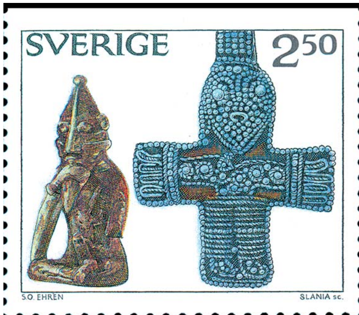
Detta frimärke, utgivet 1990, kan sägas symbolisera brytningen mellan hedendom och kristendom. Till vänster på frimärket är en gudafigur – troligen föreställande fruktbarhetsguden Frej – avbildad. I högra delen på frimärket syns ett kristet krucifix.

En bättre källa är i så fall de gotländska bildstenarna. På flera av dem kan man nämligen finna motiv som återkommer i de skriftliga källorna, motiv som återger religiösa ritualer, men även kopplingar till själva mytologin går här att göra. Odens häst, den åtta-benta Sleipner, finns avbildad på ett flertal av de gotländska bildstenarna.