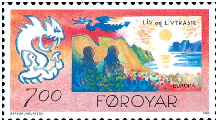
Liv och Livtrasir, människoparet som mirakulöst överlevde Ragnarök, ser solen gå upp över den nya jorden på detta frimärke från Färöarna, utgivet 1995. Även draken Nidhögg skymtar förbi. I frimärkets vänstra hörn slåss den starke åsk- och vindguden Tor med Midgårdsormen.

Kvinnan fick genomgå en lång rad ritualer. Slutligen hade hövdingens närmaste män rituellt könsungänge med slavinnan varefter en äldre kvinna, av Ibn Fadlan kallad "dödens ängel", trädde in. Hon