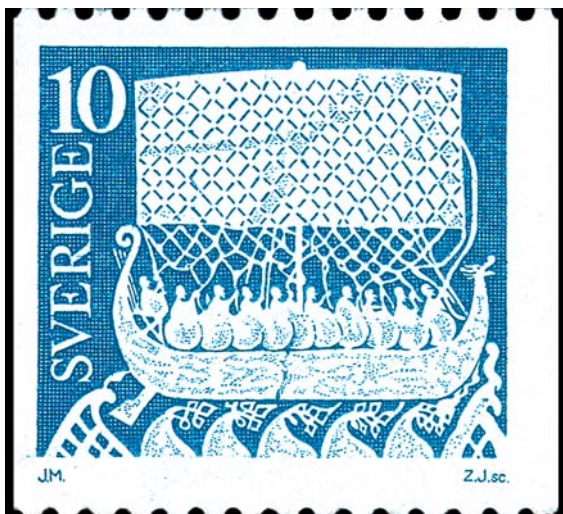
Motivet på detta frimärke, utgivet 1973, är hämtat från den märkliga bildsten som under 700-talet restes på norra Gotland, i Lärbo socken. Bilden kan mycket väl föreställa de stupade krigarnas sista färd till Valhall.