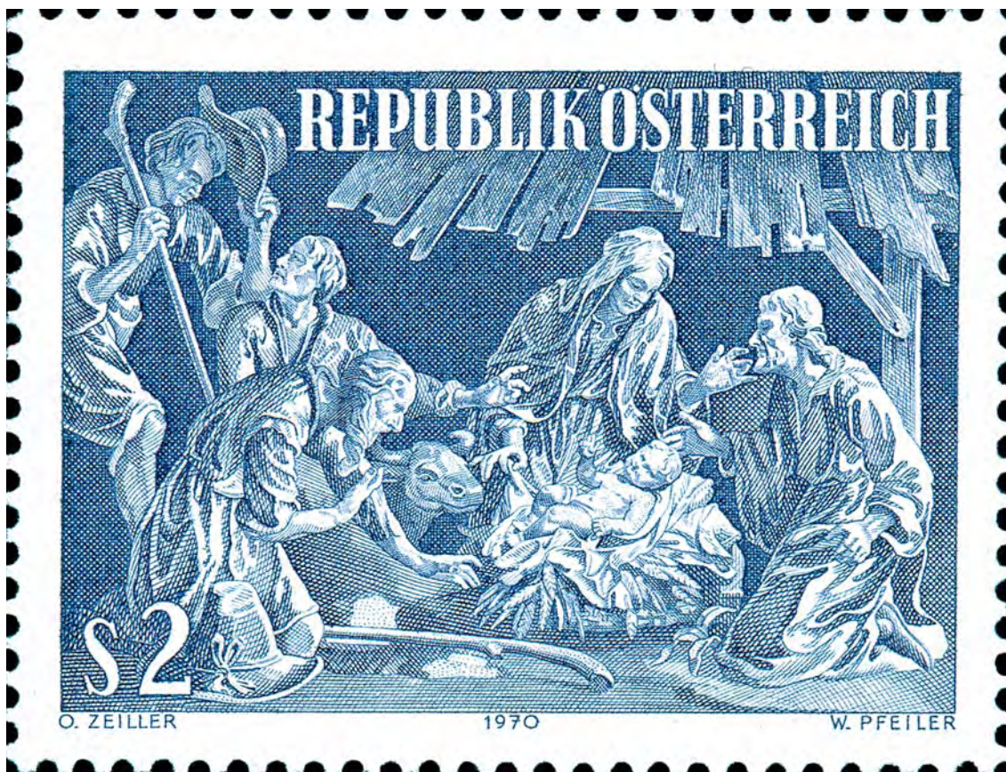
Heliga Birgittas sista vallfärd gick till det heliga landet (Palestina). I Betlehem skall hon i en syn ha fått se ett naket Jesusbarn med jungfru Maria knäböjd vid dess sida. Denna syn kom att få stor inverkan på kyrkokonsten. Tidigare hade nämligen Jesusbarnet avbildats lindat och jungfru Maria liggande. På detta vackert graverade frimärke utgivet av Österrike 1970, syns förutom Jesusbarnet och jungfru Maria även Josef och de tre herdarna.

Vad gjorde då Birgitta för att fördriva tiden? Hon besökte olika helgonplatser och gick runt i de många kyrkor som fanns i Rom, och överallt blev hon till en början mycket vänligt bemött. Ryktet hade nämligen spritt sig hela vägen från Sverige om kvinnan med de märkliga förmågorna.