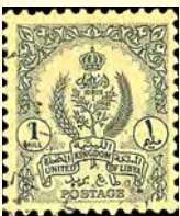
1955 United Kingdom of Libya: 1 mill