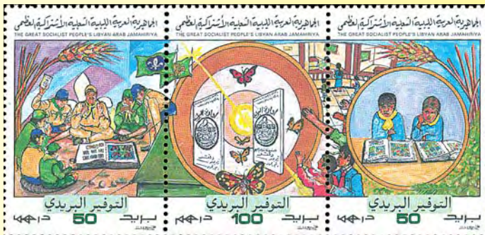
1997: Tre märken med scouter där de till höger studerar ett frimärksalbum, 50, 100, 50 d