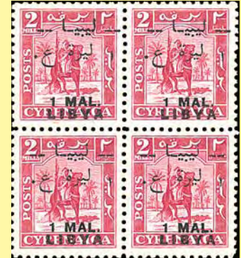
1951 Libia: Överttryckt märke från Cyrenaica som utgavs vid självständigheten i valutan "Military Authority Lire", 1 MAL Libya