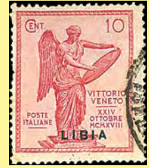
1922 Libia: Överttryck på italienskt minnesmärke över segern i första världskriget 10 c