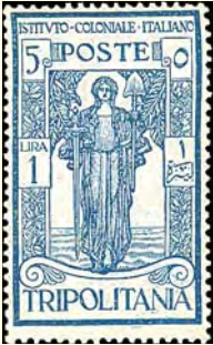
1926 Tripolitania: Propaganda för det italienska koloniinstituet 1L+5c