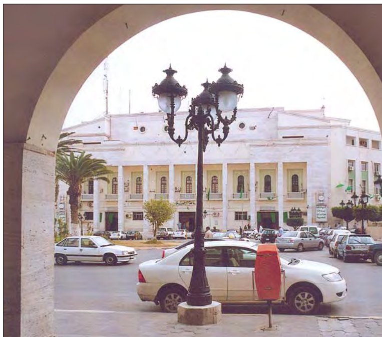
Huvudpostkontoret i Tripoli.