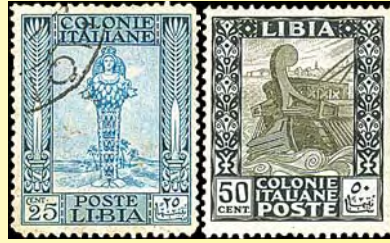
1921 Colonie Italiane: Goddess of Plenty 25 c; Roman Galley 50 c