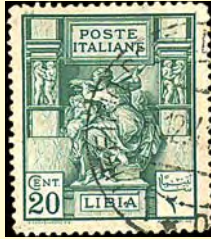
1924 Poste Italiane, Libia: "Libyan Sibyl" av Michelangelo 20 c