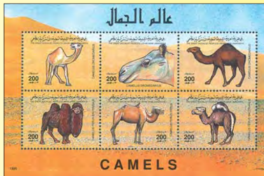
1996: Block med olika kameldjur, 6 x 200 d