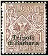
1909 Tripoli di Barberia: Överttryck på italienska frimärken, 1 c