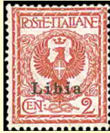
1912 Libia: Överttryck på italienska frimärken, 2 c