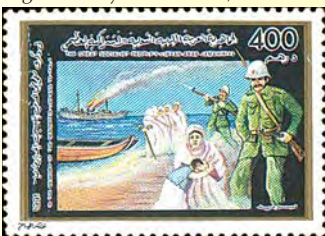
1991: 80-årsminnet av deporteringen av libyer till Italien, 400 d