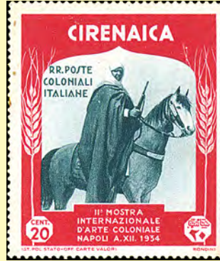
1934 Cirenaica: Stolt arab på hästryggen 20 c