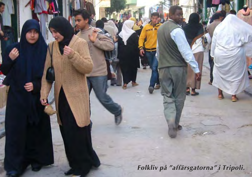
Folkliv på "affärgatorna" i Tripoli.

flygräden mot Libyen 1986, som följdes av bomben mot ett PanAm-plan över Lockerbie i Skottland 1988, där flera hundra personer omkom.