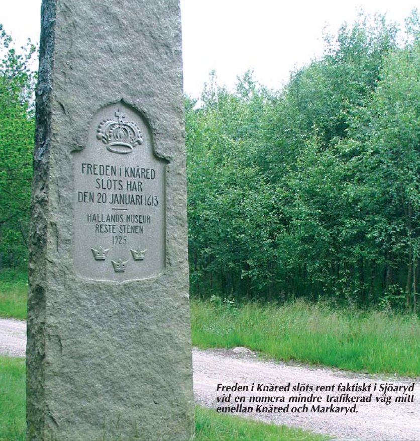
Freden i Knäred slöts rent faktiskt i Sjöaryd vid en numera mindre trafikerad väg mitt emellan Knäred och Markaryd.

vändiggjorde en mer formell organisation för posthanteringen. I Hamburg inrättades därför år 1620 ett fast svenskt postkontor, eller posthus, som det kallades på den tiden. Samtidigt inrättades en regelbunden postlinje Hamburg–Markaryd–Stockholm, en service som också kunde användas av privatpersoner.