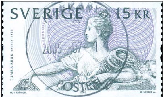
Nyligen utgivna märken avstämplade i Markaryd med dess ganska slitna stämplor.