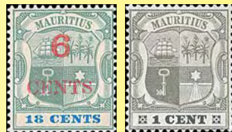
Mauritius statsvapen, med och utan påtryck (utg. 1899 resp. 1900).