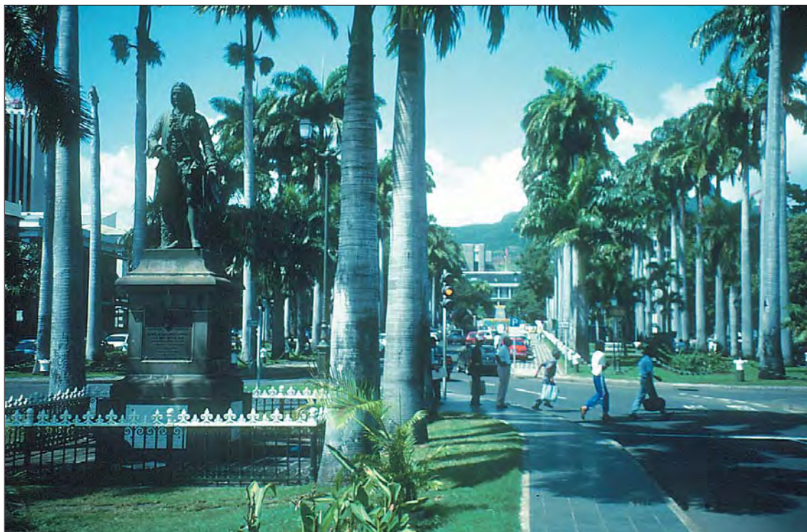
Stadsparken i huvudstaden Port Louis.