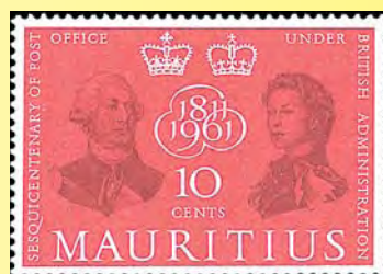
Märke utgivet till 150-årsminnet av upprättandet av den brittiska postväsendet på Mauritius (utg. 1961).