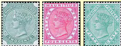
Drottning Victoria i tre olika utföranden (utg. 1879).