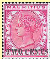
Påtryck "Two Cents" på drottning Victoria "Four cents" (utg. 1891).