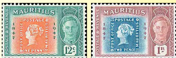
Till hundraårsjubileet av "Post Office"-märkena framställdes en serie om fyra märken som av någon anledning först gavs ut 1948. I dessa ser vi bilder av de första frimärkena.