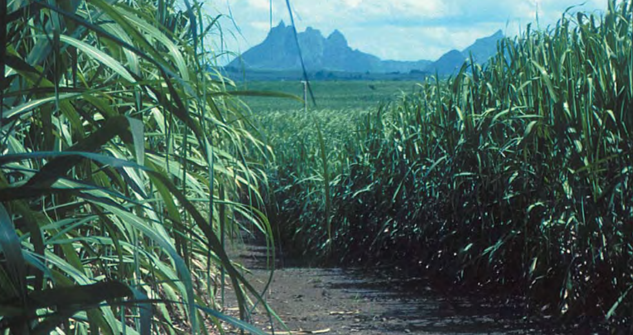
Sockerrörplantagerna täcker en stor del av ön