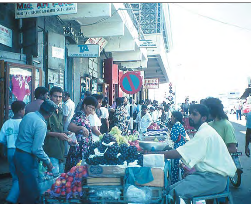
Utomhusmarknad i Port Louis.

I huvudstaden Port Louis finns ett trevligt postmuseum där också försäljning av filatelistiskt material försiggår. □