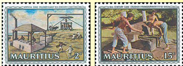
Odling av sockerrör var tidigt en viktig del av ekonomin. Frammärkena visar hur sockerrören pressas på 1700-talet resp. 1800-talet (utg. 1969).

Naturforskaren Charles Telfair som var samtida med Charles Darwin, betydde mycket för utvecklingen av Mauritius' sockerindustri, men han grundade också en botanisk trädgård på ön (utg. 1969).