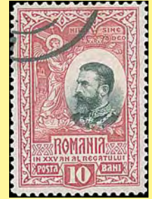
Kungadömet 25 år, kung Carol I (10 bani, 1906)