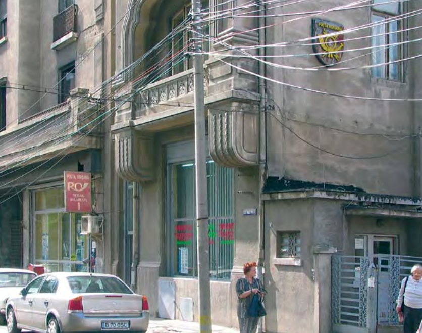
Ett litet lokalt postkontor i Bukarest med det sedvanliga knippen telefonledningar på gatan utanför.

lades ut i all världens TV-kanaler julen 1989.