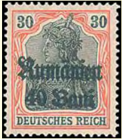
Tysk ockupation av Rumänien under första världskriget (40 bani på tyskt märke 30 pf, 1918)