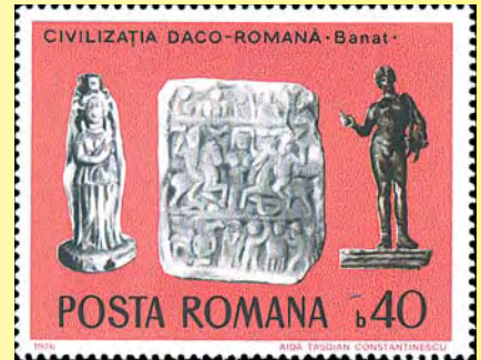
Arkeologiska fynd från romartiden. Skulpturer (40 b, 1976)