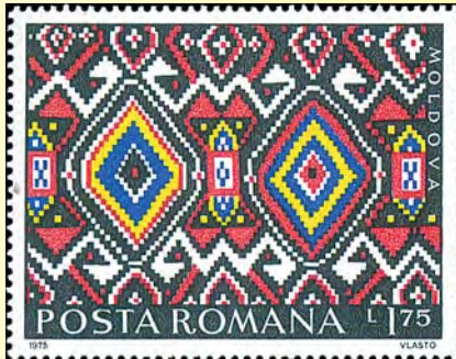
Rumänien är känt för fina handknutna mattor. Denna är från Moldavien (1,75 lei 1975)