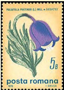
Rumänien har en varierad flora. Backsippa (5 bani, 1970)