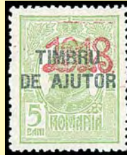
Under vissa tider var det obligatoriskt att tilläggsfrankera med välgörenhetsmärken på inrikes brev (5 bani 1918, 25 bani, 1921)