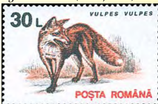
I Rumänien finns mycket vilda djur som björn, varg, lo. Motivet på detta märke är dock mera beskedligt – en röd räva (30 lei, 1993)