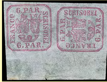
Ett par av Rumäniens första märken – med Moldovas tjurhuvud och Valakiets örn (6 parale, 1862)