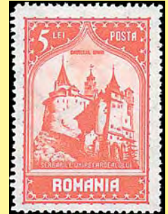
Ur serien 10-årsminnet av unionen mellan Rumänien och Transsylvanien. Slottet i Bran – Draculas slott (5 lei, 1929)