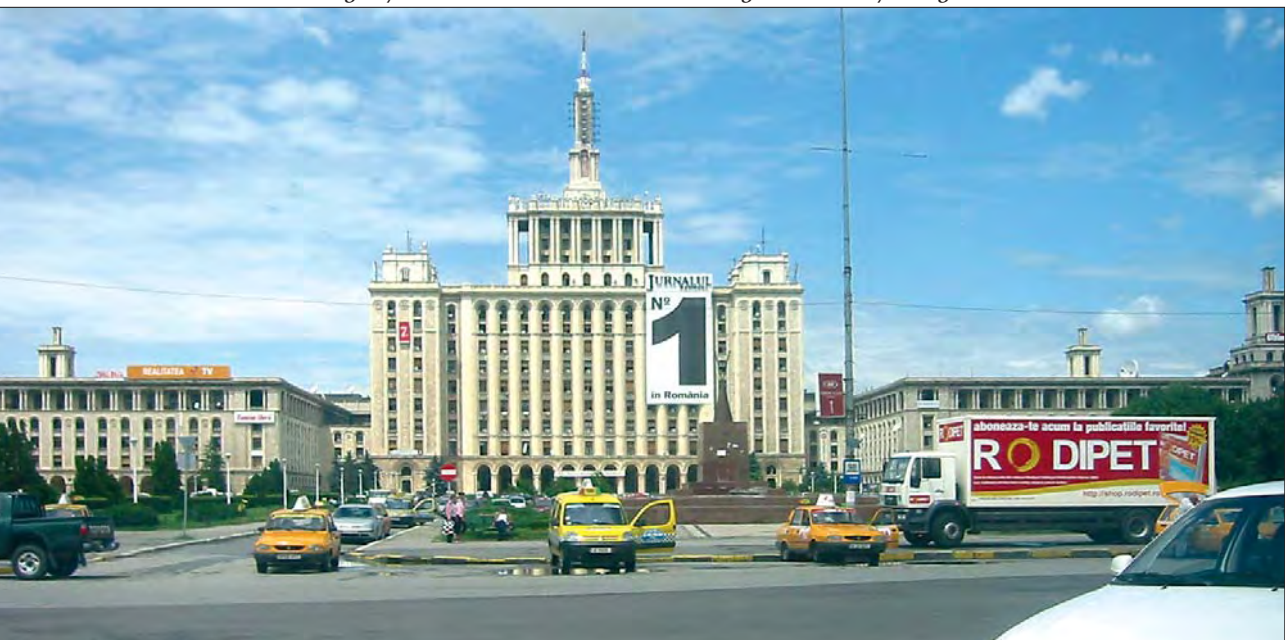
Det stora statliga tryckeriet i Bukarest som åtminstone tidigare stod för tryckning av alla alster.

Övergången från det socialistiska till det marknadsorienterade samhällskicket skedde ändå under spektakulära förhållanden, när Ceaușescu och hans fru Elena fruktlöst bad för sina liv innan de avrättades – något som välvilligt kab-