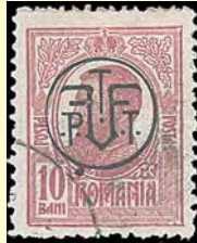
När Ferdinand blev kung övertrycktes märken med hans monogram (1919)